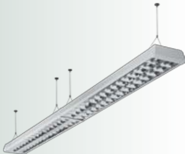
Светильники TOP с матовой решеткой, выстроенные в линию.