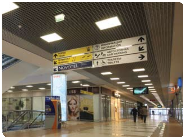
Аэровокзал аэропорта «Шереметьево» (Москва)