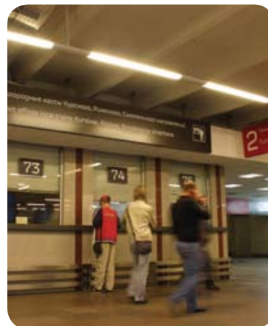
Курский вокзал (Москва)