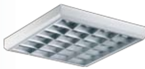
Светильник может комплектоваться решеткой из матового алюминия.