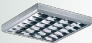
Цвет корпуса — металл.

Зеркальная параболическая решетка изготовлена из анодированного алюминия. Устанавливается в корпус скрытыми пружинами.