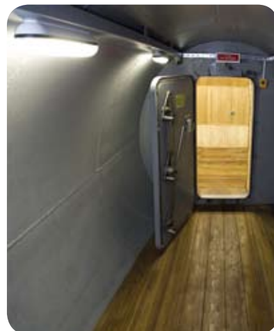
Интерьер экспериментального комплекса «Марс-500» (Москва)