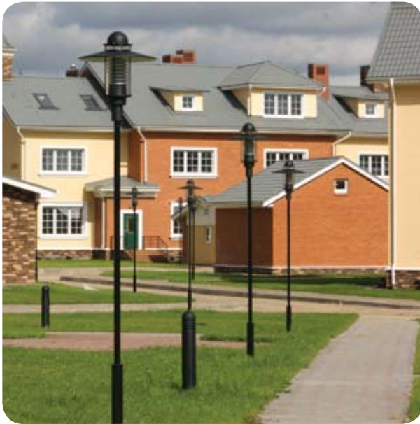
Клубная резиденция «Ангелово» (Московская обл.)