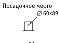
NTV 190 H150