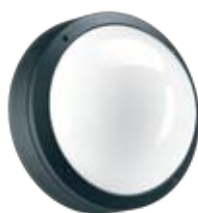
Цвет корпуса – черный.