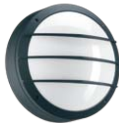
Цвет корпуса – черный.