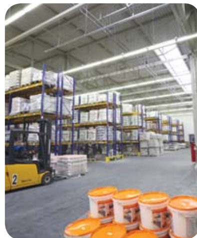
Завод ООО «Малино-Капарол» (Ступино)