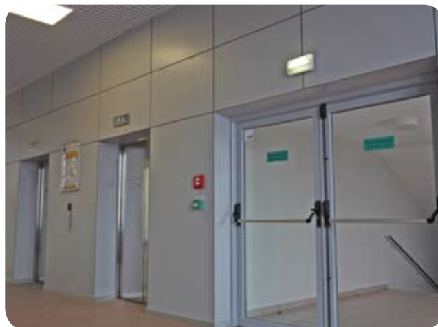
Аэровокзал аэропорта «Шереметьево» (Москва)