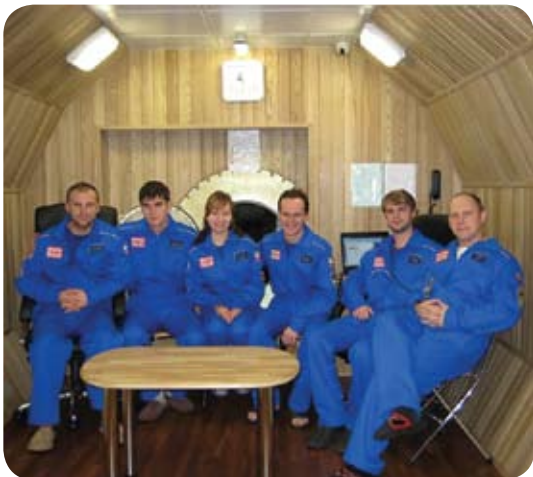
Интерьер экспериментального комплекса «Марс-500» (Москва)