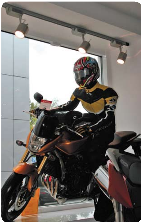
Техцентр Honda «Аояма Моторс» (Москва)