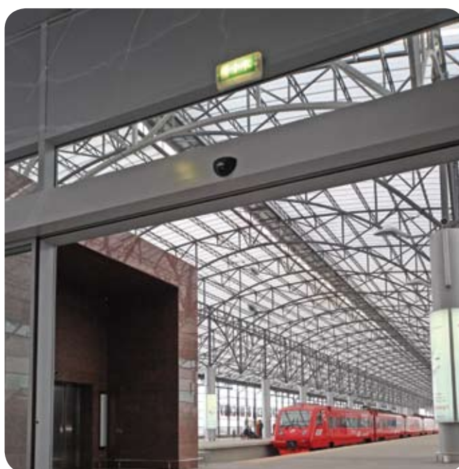
Аэровокзал аэропорта «Шереметьево» (Москва)

Рассеиватель светильника изготовлен из прозрачного поликарбоната. Дополнительно к светильникам предлагаются пиктограммы (см. стр. 316).