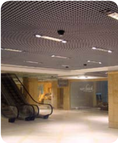
ТДЦ «Европа» (Екатеринбург)