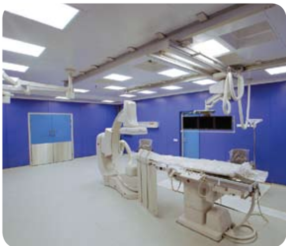
Национальный медико-хирургический центр им. Пирогова (Москва)