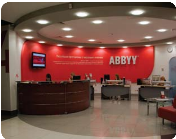
Офис компании АВВУУ (Москва)