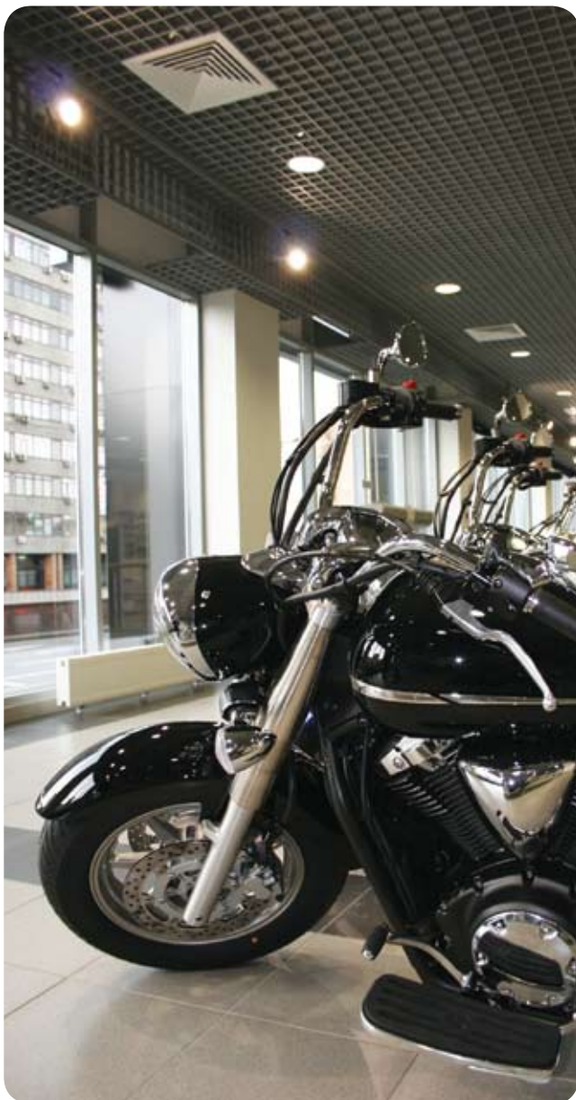
Yamaha Мотор Центр Суцевский (Москва)