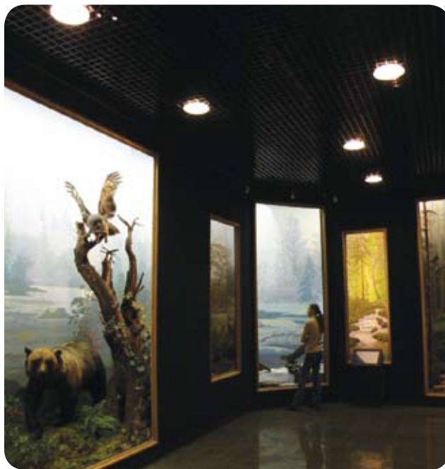
Краеведческий музей (Хабаровск)

Зеркальный отражатель из анодированного алюминия и силикатное стекло (виды стекол см. на стр. 129). Стекла заказываются отдельно.